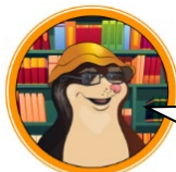
БИБЛИОТЕКАРЬ СУМЧАТЫЙ КРОТ

Роман воспитания – история становления характера, формирования личности героя.